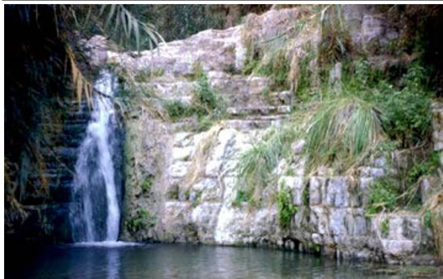
Casacadă la oaza En-Ghedi în pustie

Biserica Baptistă Română din Metropola Chicago 484 E. Northwest Hwy (505 State Street), Des Plaines, IL 60016 Radio: WEEF 1430AM, duminica dimineața între 8:30 și 9:00 http://www.rbc-chicago.org