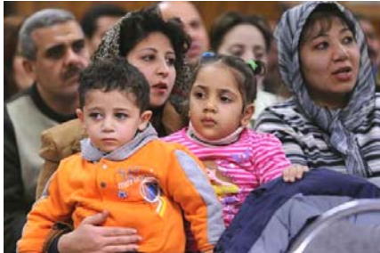
Rugați-vă pentru creștinii din lumea arabă

■ Papa Benedict XVI s-a întâlnit în februarie cu dna. Nancy Pelosi, șefa Camerei Deputaților din Washington, și a atacat direct poziția acesteia în legătură cu avortul. După întâlnirea care a durat numai 15 minute, Vaticanul a dat un comunicat, în care scrie: „Preasfinția Sa a folosit ocazia să