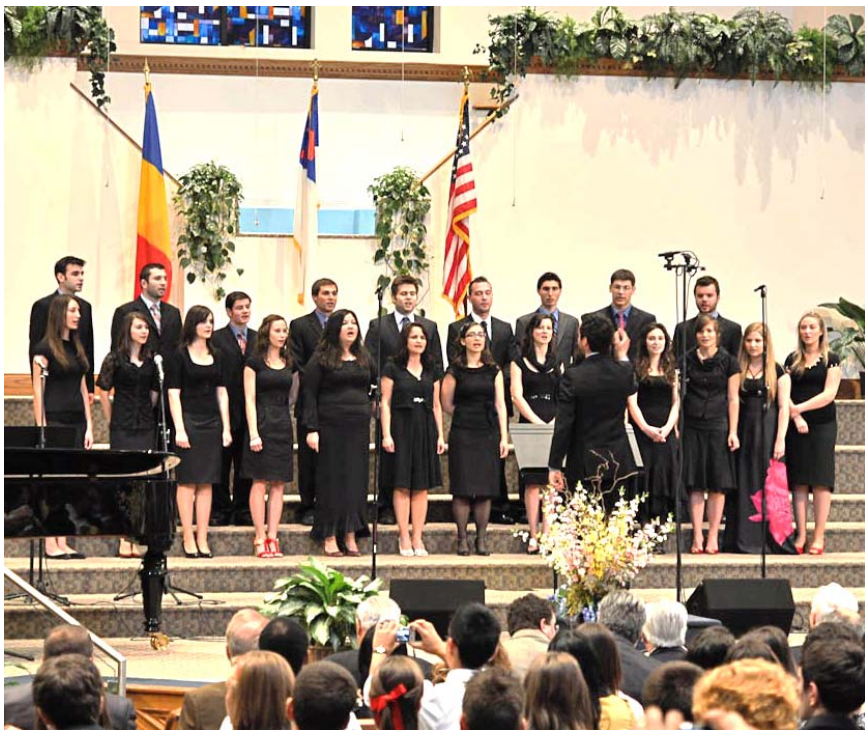
De la Festivalul Corurilor de Tineret din 23-24 mai: Tinerii noștri sâmbătă (sus) și corurile unite la Moody Church, duminică trecută seara (jos).