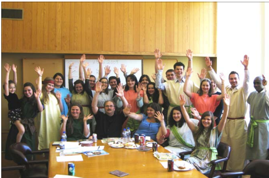
Grupul de tineri care va lucra în săptămâna viitoare la Școala Biblică de Vacanță. Dacă mai sunt și alții care doresc să ajute, sunt bine veniți.