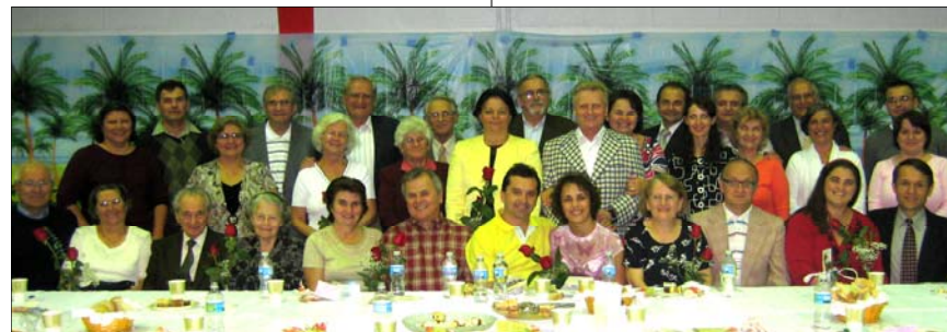
Joi, 27 august, la masa de părtășie a celor ce au avut cununia în luna august